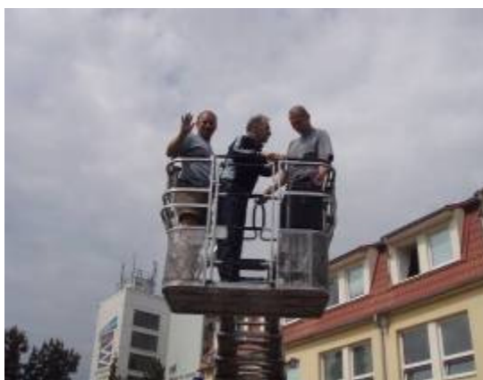
• exkurze u Hasičského záchranného sboru