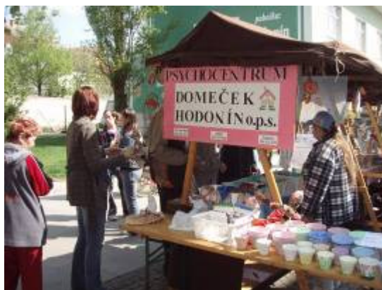
• účast Psychocentra na Dnech Zdraví