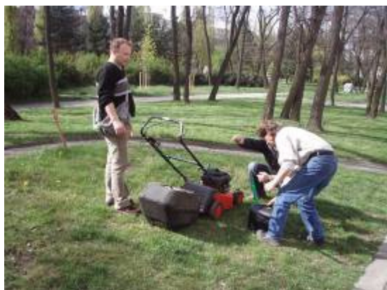
• klienti AD udržují okolí budovy

Každá ze čtyř poskytovaných služeb využívá hodnocení svých klientů jako důležitý instrument pro zkvalitňování sociální služby. Pro zjišťování spokojenosti má Psychocentrum několik nástrojů. Především to jsou dotazníky určené přímo klientům, jejichž hodnocení pravidelně probíhá. Dále je to zjišťování spokojenosti uživatelů služeb přímo sociálními pracovníky v rámci jednotlivých terapeutických skupin. Dále má každá služba zpracován metodický postup pro přijetí a vyhodnocování stížností na průběh či poskytování sociální služby, s nímž je každý klient při vstupu do služby řádně srozuměn. V roce 2008 nebyla podána žádná stížnost.