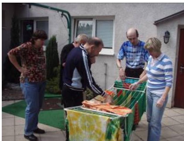
• batikování klientů sociální rehabilitace

Psychocentrum Domeček Hodonín, o.p.s. pravidelně (1x za dva týdny) poskytuje své prostory této organizaci, aby se její členové z Hodonína měli kde setkávat. Psychologická poradna jim také zajišťuje své odborné služby.